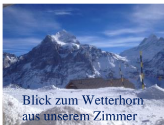
Blick zum Wetterhorn aus unserem Zimmer