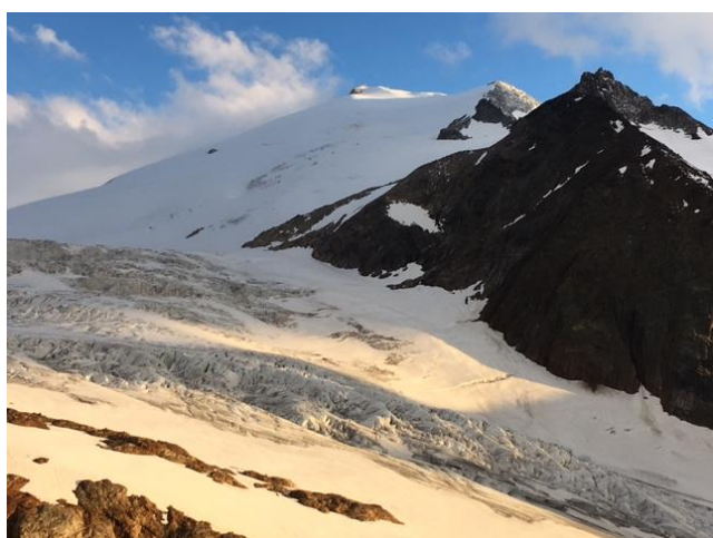
Diechterhorn von der Trifthütte aus