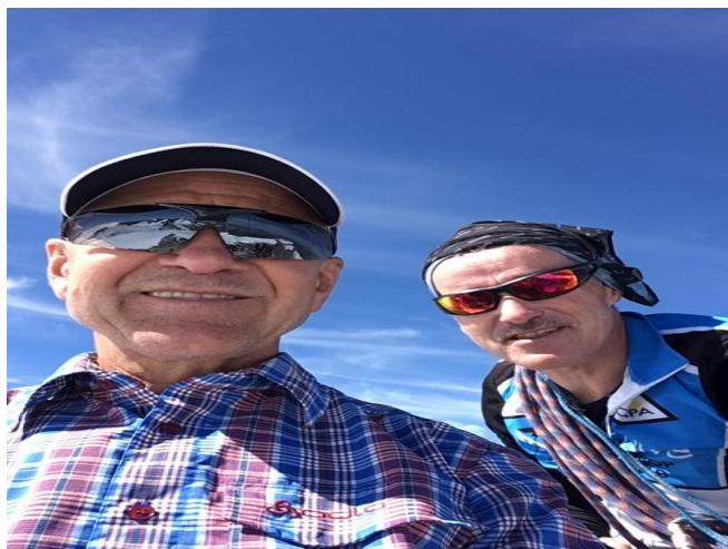
Selfie auf 3'388m.ü.M.