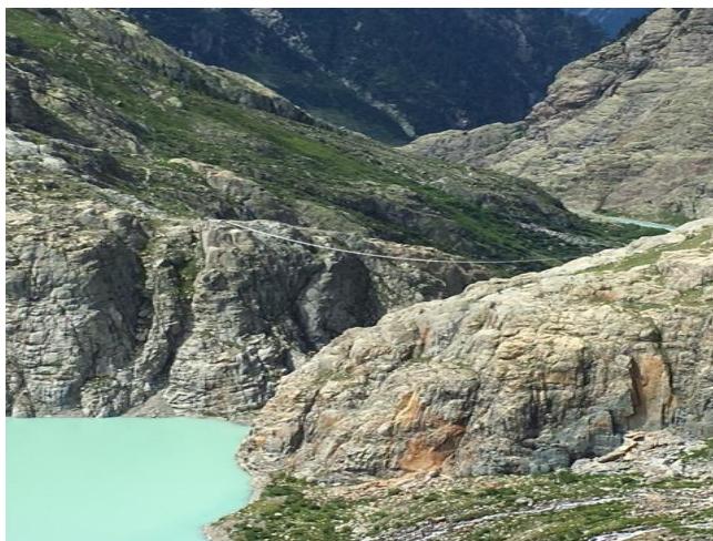
Triftbrücke mit See