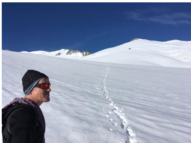
Aufstieg zum Diechterhorn / Gipfel mitte rechts