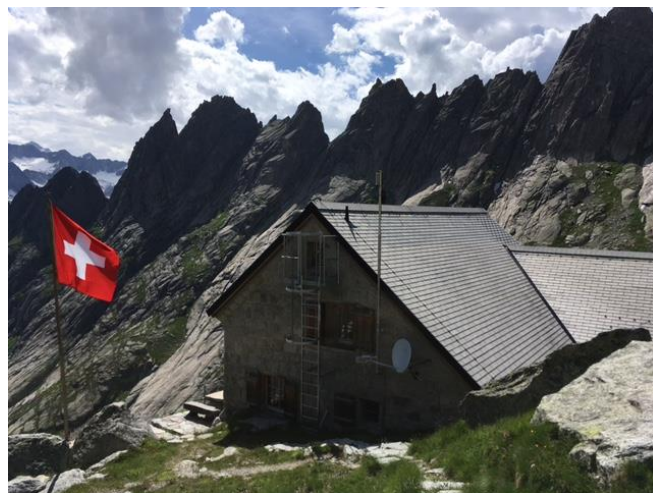
Gelmerhütte mit Gelmerhörnern